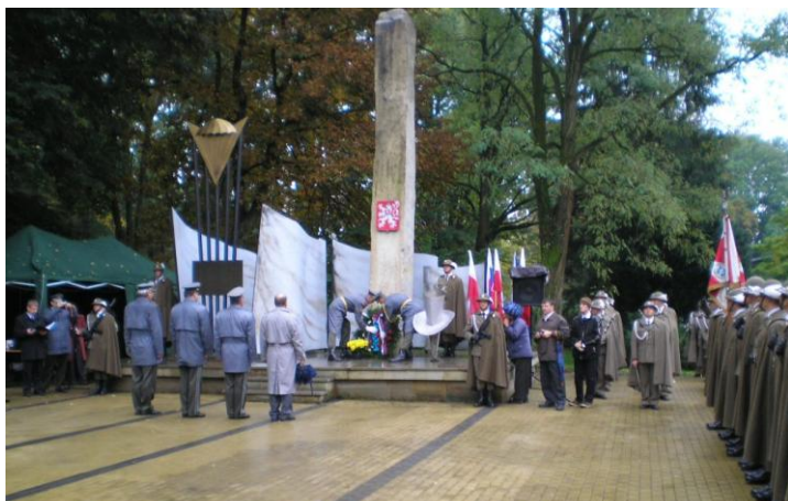
Pamätník v Novosielciach. Oslavy 64. výročia bojov na Dukle.

v tyle sovietske Zagrady - odriady. Ale boli aj takí, čo sa vôbec nevrátili, lebo nemali ďaleko na Volyň a potom sa doma ukrývali až do konca vojny. Po vojne, keď sa volyňskí Česi sťahovali – presídľovali do ČSR, títo zbehovia sa nestahovali. Až neskôr, keď zistili, že ich nikto nestíhal, ani nezisťoval, kde boli, čo robili, presťahovali sa ako riadni presídlenci. Až po desiatich - dvadsiatich rokoch sa uchádzali o osvedčenia podľa zákona č. 255/46 Zb. a aj ich dostali, lebo mali svoje evidenčné číslo, poznali útvar a nikto nezisťoval, ako to s nimi bolo. Neskôr