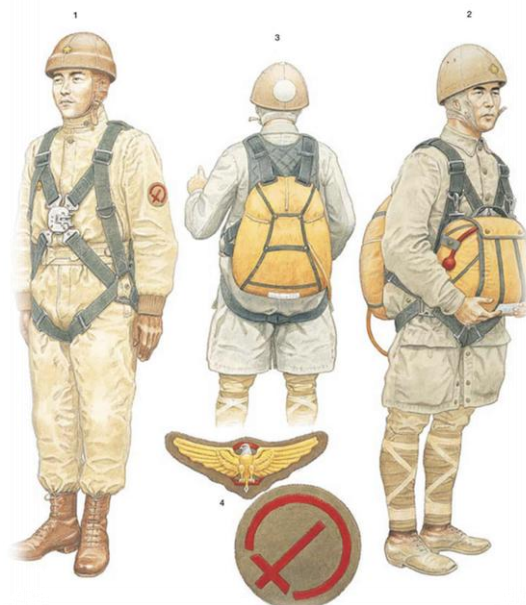
IMPERIAL JAPANESE ARMY PARATROOPS 1: Paratrooper in training, 1941 2: Paratrooper, 2nd Raiding Regt; Palembang operation, Feb 1942 3: Paratroop officer on operations, 1942 4 & 5: IJA paratrooper insignia